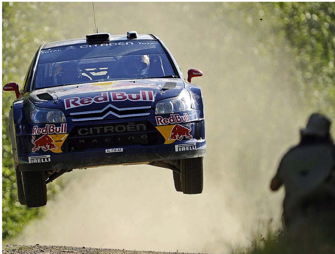
Auf zum Höhenflug oder zum Abflug? Kimi Räikkönen ist der erste Formel-1-Weltmeister, der in der Rallye-WM Fuß fassen möchte. Noch tut sich der „fliegende Finne“ aber schwer.

Es war nicht der erste heftige Unfall. Auch bei seinem ersten WM-Start 2009 in Finnland, damals noch in einem Fiat, überschlug sich Räikkönen. Kimi entstieg dem Auto ohne große Eile, mit einem Grinsen im